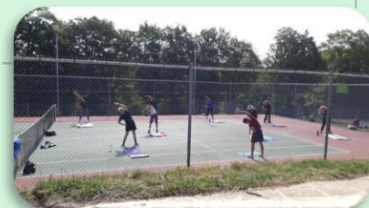
Septeuil – Juin 2020

Le Comité tient à féliciter les dirigeants de ces associations et les encourage à poursuivre leurs efforts. Nous rappelons que nous nous tenons à votre disposition pour vous accompagner dans vos actions.